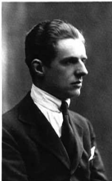
Gian Francesco Malipiero © UNIVERSAL EDITION A.G., WIEN

Sing' mir ein bisschen, und spiel mir doch Auf der Viò Auf der Viola das Kikerikiii Das Kikeriki Auf der Viola das Kikerikiii