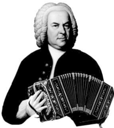
»Johann Sebastian Bach beim Bandoneón-Üben«.

»Ich habe mein ganzes Leben für den Tango gearbeitet, jetzt hoffe ich, dass der Tango für mich arbeitet. Erst mit sechzig fing ich an, Geld damit zu verdienen. Jetzt bin ich fast siebzig und habe noch viel vor«, gab er kurz vor seiner letzten Tournee zu Protokoll. Unterwegs in Paris erlitt Astor Piazzolla 1990 einen Hirnschlag, von dem er sich nicht mehr erholte. 1992 starb er in Buenos Aires.