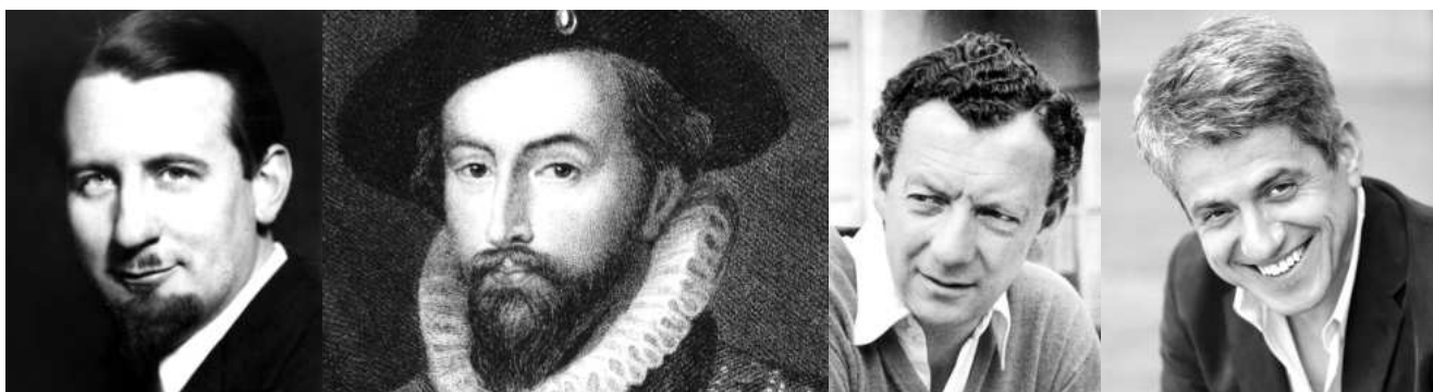
v.l.n.r.: Peter Warlock – John Dowland – Benjamin Britten – Peter Breiner

Der Pianist, Arrangeur, Komponist und Dirigent Peter Breiner veröffentlichte 2009 vier Konzerte im barocken Stil. In jedem wählte er eine andere »Handschrift«, um darin Beatles-Songs einzubetten, etwa die Vivaldis oder Bachs... Dabei spielte er ebenso mit originalen barocken Motiven (etwa aus den Vier Jahreszeiten ) wie mit charakteristischen Satzformen (Fugato, Tanzformen) und Besetzungen (Cembalo, Solisten) wie natürlich mit charakteristischen Wendungen der jeweiligen Beatles-Songs. Im ersten Concerto steht G. F. Händel mit seinen Concerti Grossi op. 6 als Pate im Hintergrund, mit je einer kleinen Solistengruppe, bestehend aus zwei Violinen und einem Cello. Zusammen mit dem Cembalo tragen die drei im Dialog mit dem Orchester und untereinander fünf populäre Beatles Songs: She Loves You war einer der ersten großen Beatles-Hits (1963), dessen charakteristischen Schluss sie ihrem Produzenten George Martin abringen mussten und Lady Madonna mit seinen vorwärtsdrängenden Basslinien. The Fool on the Hill besticht durch eine große Solo-Cello-Partie, Honey Pie durch ein kunstvolles Fugato, während Penny Lane als Gigue fröhlich und sonnig im 6/8-Takt daherkommt. Während She Loves You und Penny Lane Gemeinschaftsproduktionen von Lennon/McCartney waren, stammen die drei anderen alle aus McCartneys Feder, auch wenn sie offiziell unter der Autorschaft beider registriert sind.